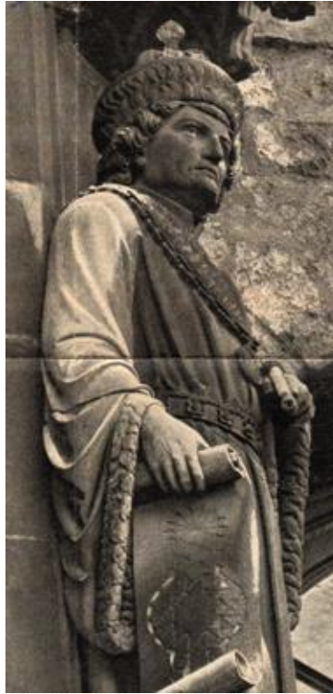
Beeld van Gerhard Chorus op de traverse van het octagoon van de Dom in Aken